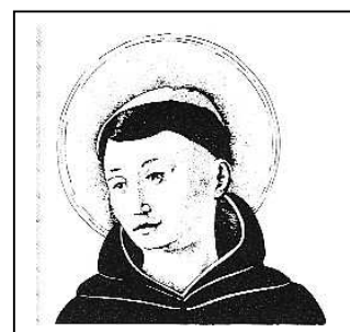
Thomas von Aquin

Und Er will, dass wir uns daran wie auch an anderen Vergnügen erfreuen. Aber wenn wir nicht sorgsam sind und die Neigungen zu diesen sinnlichen Vergnügen mäßigen, werden wir uns mit ihnen voll füllen und dann nicht mehr fähig sein, uns am „Hauptgericht“ im Leben zu erfreuen, d.h. an den höchsten Gütern des Lebens, wie Wahrheit, Güte, Schönheit, Freundschaft und Liebe. Der Mensch ist für mehr als nur für das Vergnügen geschaffen. Ein Mangel an Mäßigung hindert ihn daran, seinen GOTT, seinen Ehepartner, seine Kinder und seine Freunde so sehr zu lieben, wie er sie lieben könnte. Wenn es einem Menschen an Selbstkontrolle mangelt, wird er oft seine Wünsche und Vorlieben egoistisch vor andere stellen. Oft nimmt er die Nöte seiner Umgebung gar nicht wahr.