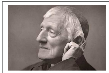
Kardinal John Henry Newman

(The Present Position of Catholics in England, IX, 390).